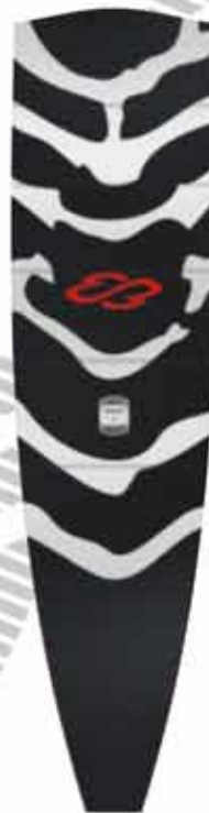
D7 kovinsko siva