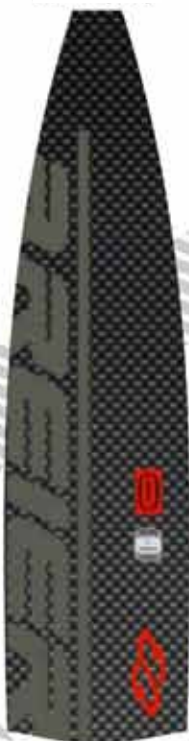
D1 temno siva

Doplačilo za natisk na eni strani je 10 eur.